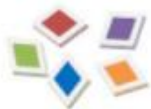
Cell/tissue lysate or serum