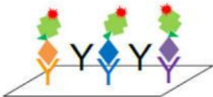
Detection by Cy3-streptavidin