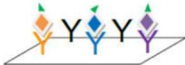
Protein conjugation to antibody array